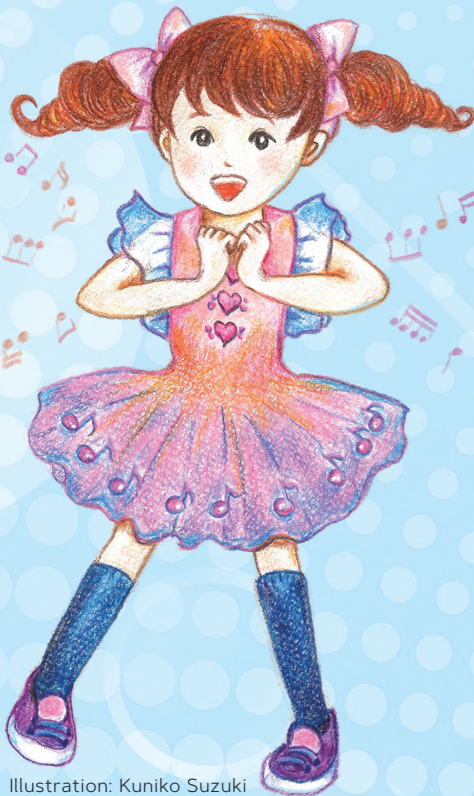
Illustration: Kuniko Suzuki